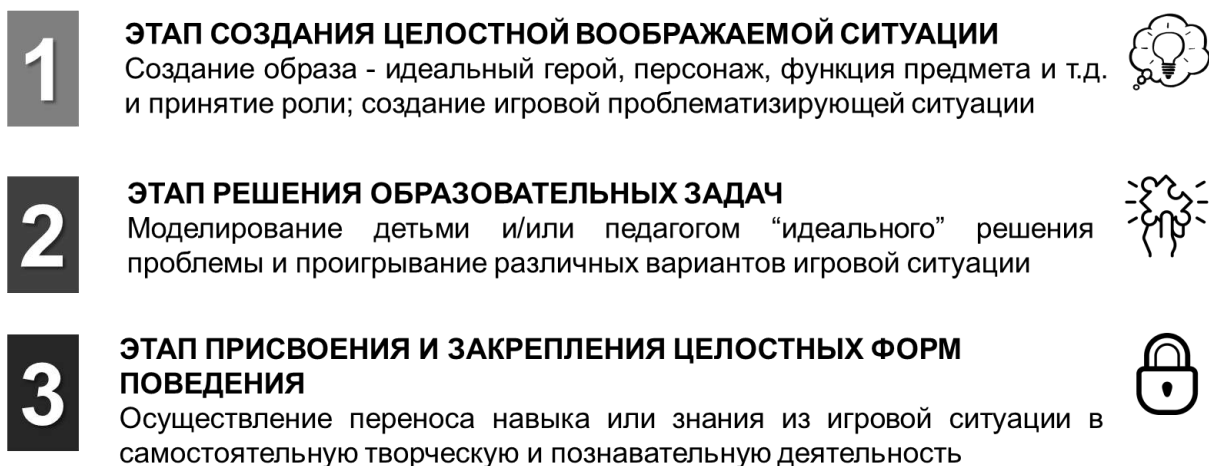
Рис. 1 Алгоритм разработки и совершенствования игровых технологий